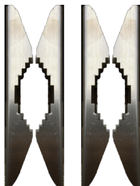
BS-SBA001PMA Kit fissaggio a palo