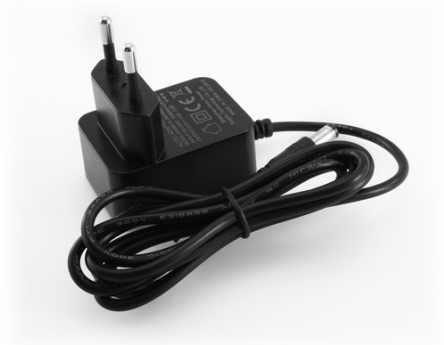
Alimentatore 5Vdc 1A